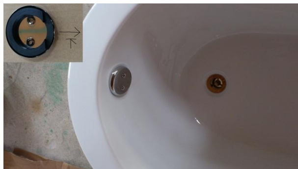
8. オーバーフローキャップは、切欠き部を下に向けビスで締め付ける。