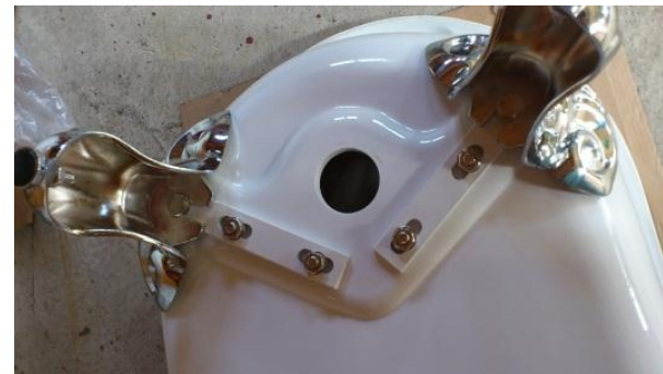
3. 脚を四か所、ボルトとワッシャーで取り付ける。