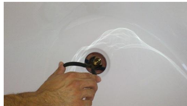
6. ラジオペンチ等で、排水金具を締め付ける。