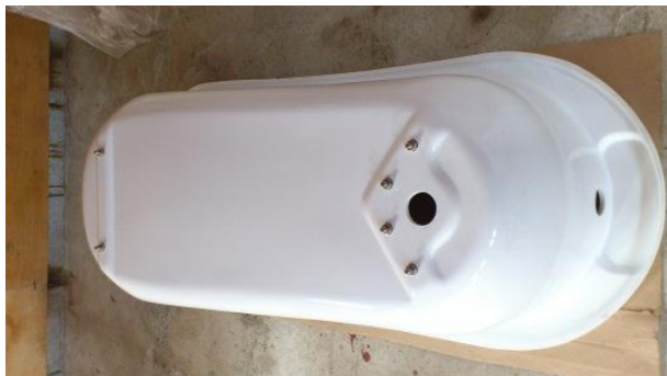
1. 浴槽下部のナットとワッシャーを取り外す。