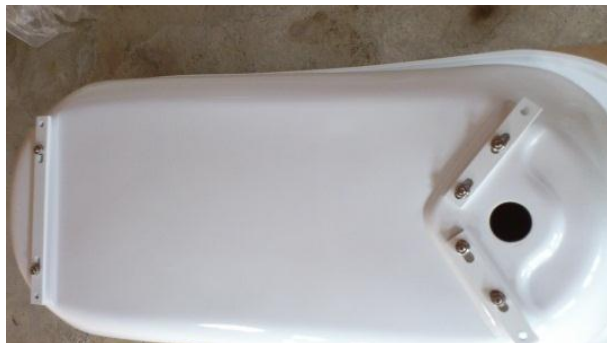
2. ステーをワッシャーとナットで取り付ける。